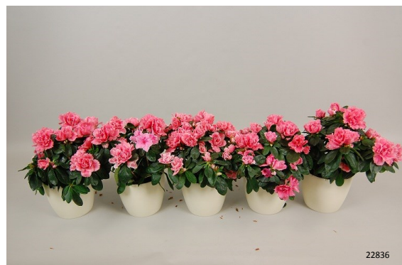
Behandeling: Chrysal Aqua Pad Foto: dag 7