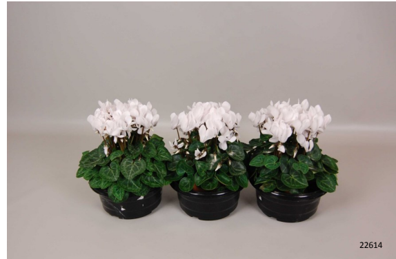
Behandeling: Chrysal Aqua Pad Foto: dag 10