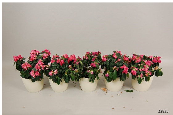
Controle (niet behandeld) Foto: dag 7