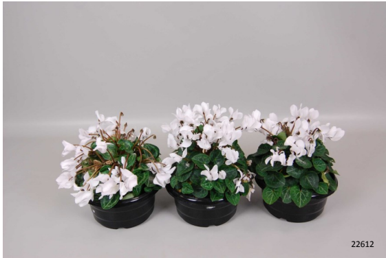
Controle (niet behandeld) Foto: dag 10