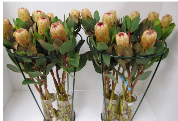
Behandeling: Chrysal Grow 40 als voorbehandelingsmiddel en tijdens transportfase / water tijdens winkel- en consumentenfase