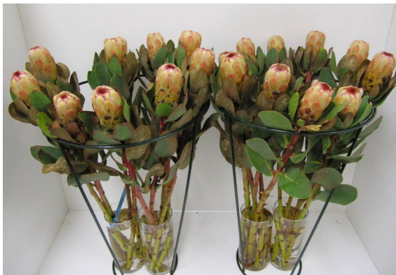
Behandeling: water tijdens transport-, winkel- en consumentenfase