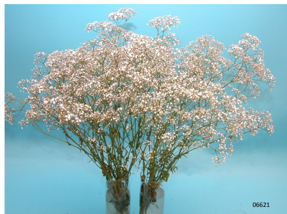
Tratamiento: Chrysal OVB Vida en florero total: 12 días Fotografía tomada: día 12