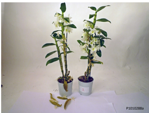
Controle (niet behandeld)

3 dagen transportsimulatie – Foto dag 8 in winkel