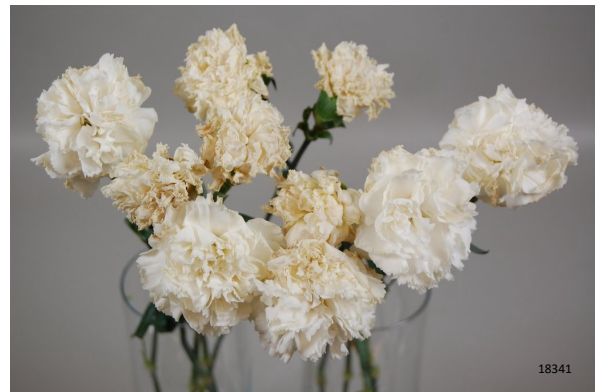
Behandeling: Ethylene Buster® tabletten Vaasleven: 12 dagen Foto: dag 12