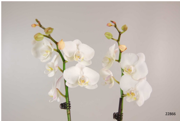
Controle (niet behandeld)

5 dagen transportsimulatie – Foto dag 7 in winkel