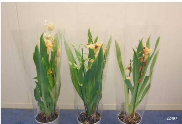
Controle (niet behandeld)

5 dagen transportsimulatie – Foto dag 7 in winkel