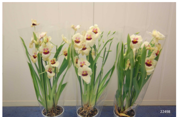
Ethylene Buster® tabletten