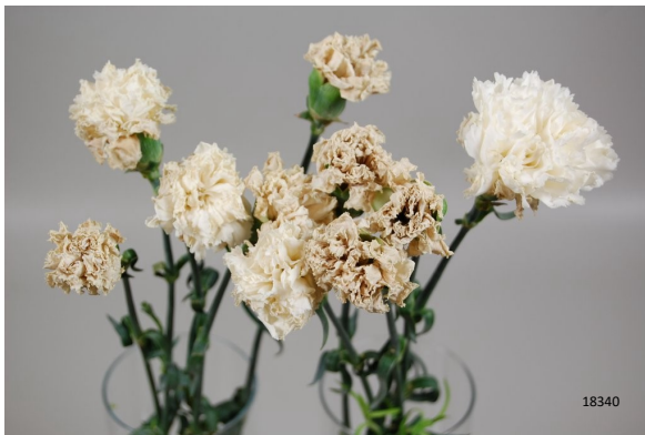
Behandeling: controle (niet behandeld) Vaasleven: 9 dagen Foto: dag 12