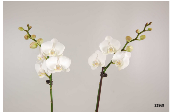
Ethylene Buster® tabletten