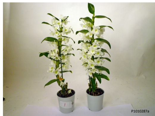
Ethylene Buster® tabletten