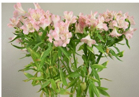
Alstroemeria 'Wonder Sweet' – Dag 18