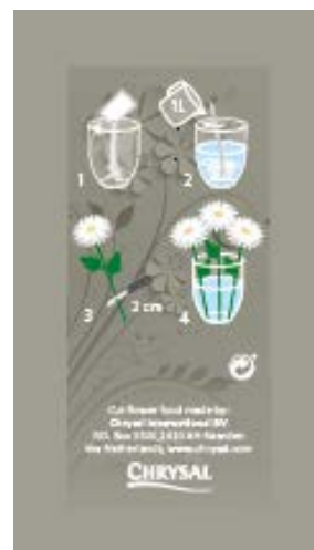
3. Exemple de sachet personnalisé – Face arrière format portrait

N'utilisez pas une couleur différente, au risque d'avoir des imperfections sur l'impression de la cellophane.