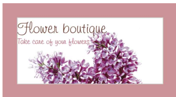
Figuur 2. voorbeeld eigen ontwerp - Horizontale voorkant