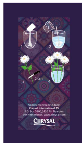
Figuur 3. Voorbeeld eigen ontwerp – Verticaal achterkant

Kies geen andere kleur, dit kan problemen bij het drukken van folie veroorzaken.