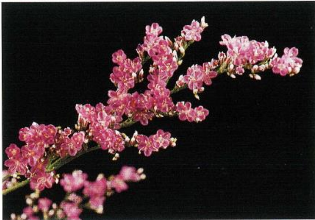
クリザール スターチス 使用 5倍希釈 × 10時間処理