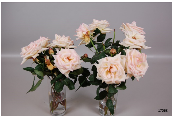
Tratamiento: ninguno Foto tomada: día 7