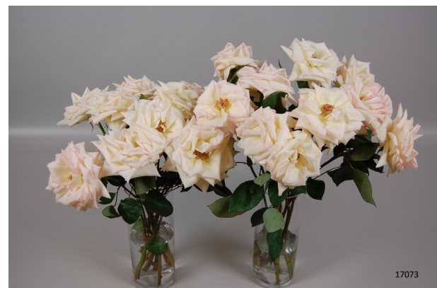
Tratamiento: Chrysal Batine Foto tomada: día 7