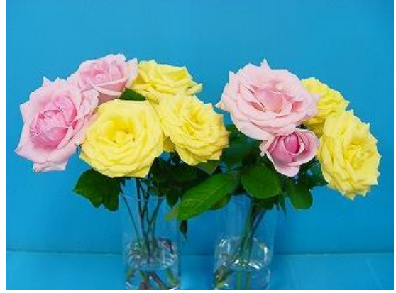
フラワーフード液体