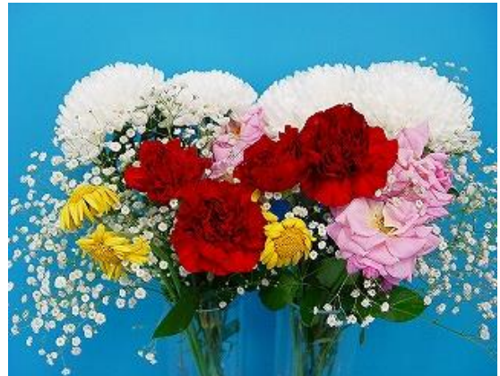
フラワーフード液体