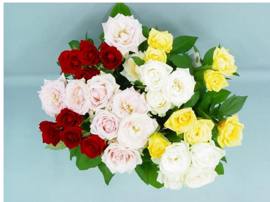
プロフェッショナル2