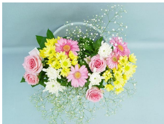
プロフェッショナル2