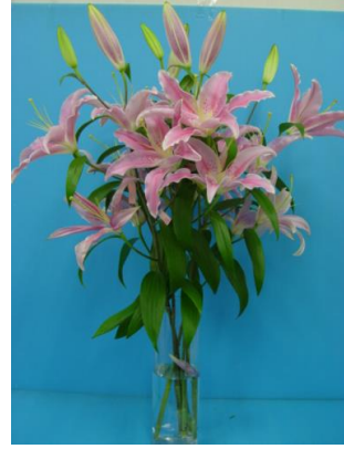
ユリ・アルストロメリア用小袋