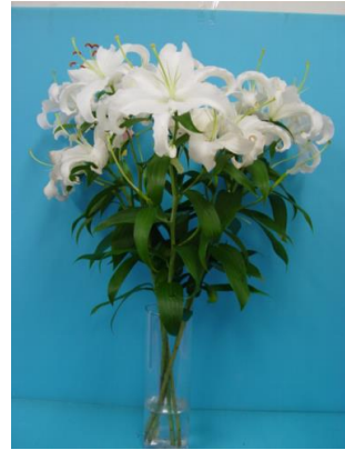
ユリ・アルストロメリア用小袋