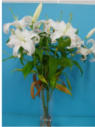
フラワーフード小袋