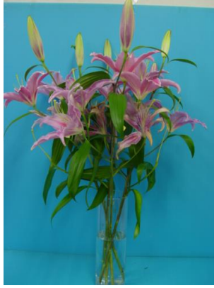
フラワーフード小袋